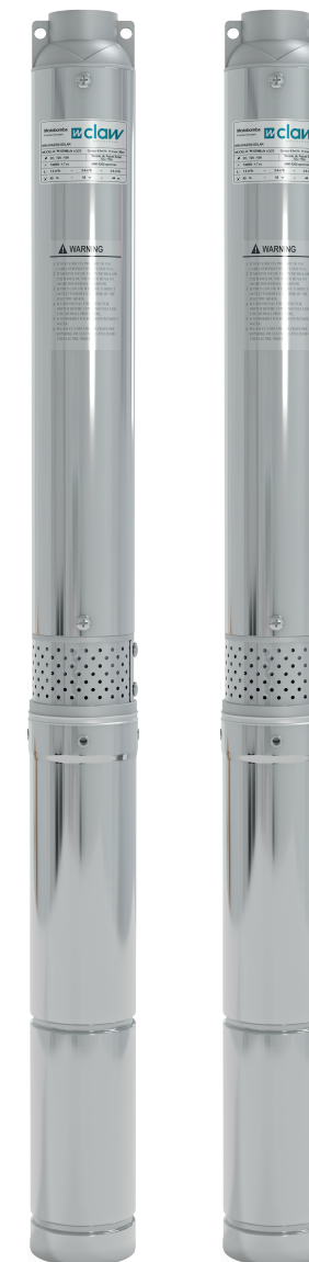
Ferro Fundido ou Aço Inoxidável